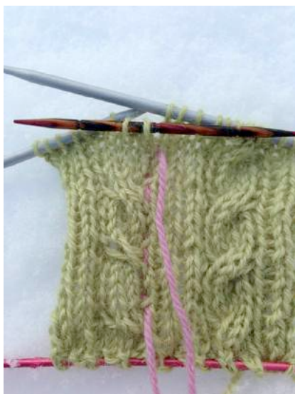
Venstrevidd flette første steg