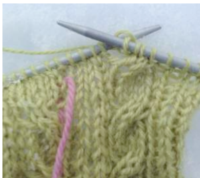
Høyrevridd flette ferdig