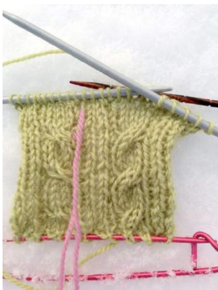
Høyrevridd flette første steg